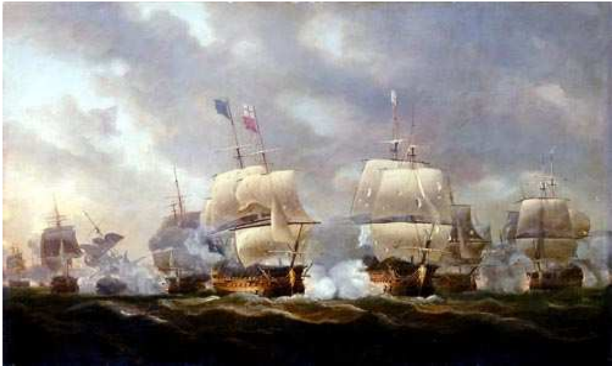
La bataille des Cardinaux, Nicolas Pocock, 1812. (National Maritime Museum)

« Si j'avais su l'état de notre marine, peut-être que je n'aurais pas eu le courage de présenter un projet d'expédition. »